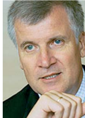
Horst Seehofer Bundesminister

Unter den Prominenten von heute gibt es viele in Wirtschaft und Politik, die ihre persönliche Erfolgsstory mit einem Studium an einer Verwaltungs- und Wirtschaftsakademie begründet haben und im BDIVWA ihre berufspolitische »Heimat« gefunden haben. Und die Prominenten von morgen findet man unter den jungen Absolventen und jetzigen Studenten der VWA.